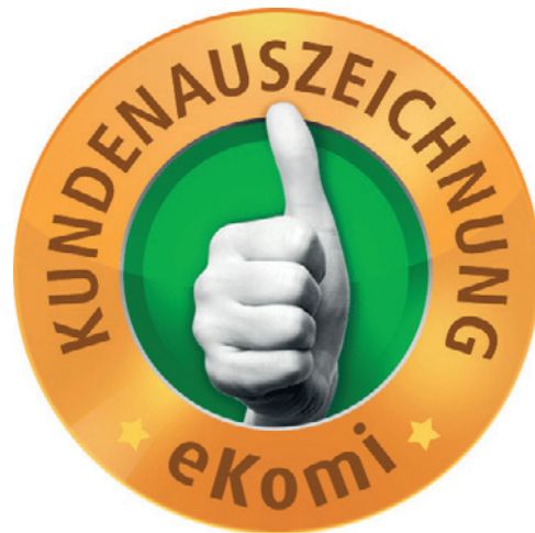
eKomi Siegel Gold (Stand: 30.07.2019), Zeichen zufriedener Kunden.