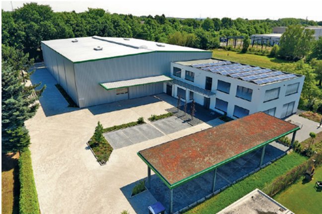
Sitz der RUNDAS-GmbH in Dinslaken am Niederrhein.